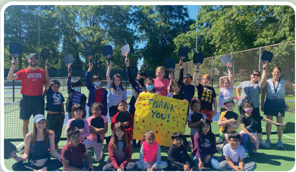
Los estudiantes aprenden a jugar pickleball durante el programa de verano Imagine the Possibilities de junio en la escuela primaria Jefferson

Uno de los aspectos más destacados fue la exhibición de arte que les dio a los padres la oportunidad de venir y ver lo que crearon sus hijos. El objetivo general de este programa era involucrar a los estudiantes en actividades de aprendizaje que sean divertidas. Los maestros ciertamente lograron este objetivo y más. ¡Gracias a todos aquellos que participaron!